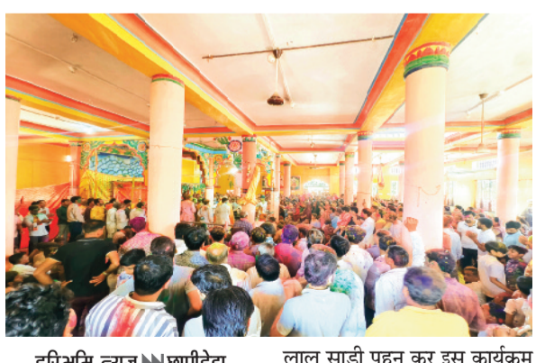
छापीहेड़ा