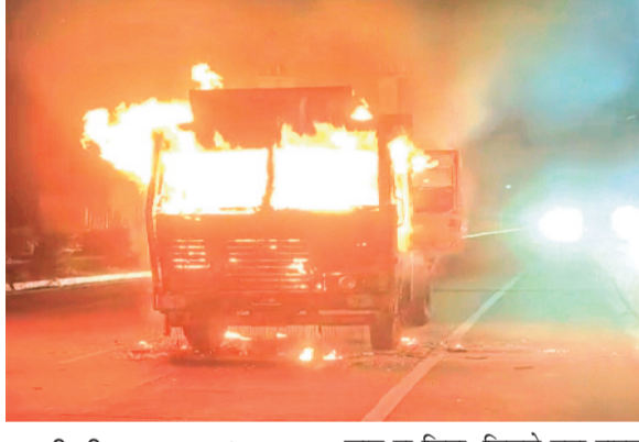
हरिभूमि न्यूज ►► सारंगपुर