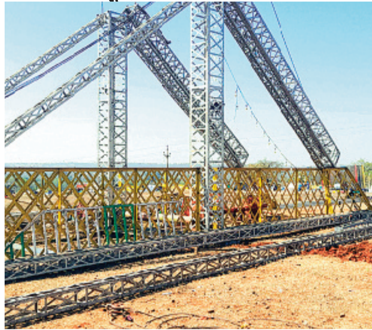
हरिभूमि न्यूज ►► ब्यावरा/राजगढ़

लेकिन हद तो जब हो गई कि वक्फ बोर्ड ने पूर्व की कमेटी के चार माह बाकी होने पर भी एक नई कमेटी पैराशूट से उतार दी। नव गठित कमेटी ने पूर्व कमेटी से अपना हिस्साब किताब मांगना शुरू कर दिया और पूर्व कमेटी के द्वारा किए गए सभी टेंडर को निरस्त करते हुए अपने निजी मंगलदंत कष्टानी बनाकर निजी स्वार्थ के लिए मंगलदंत टेंडर करना शुरू कर दिए। लेकिन जब मने का दिन करीब आने लगा तब ही शहर में सुखिल समुदाय के लोगों ने रोस सा छा गया और दबी जुबान से सब वक्फ बोर्ड का विरोध करने पर उतारू हो गए।