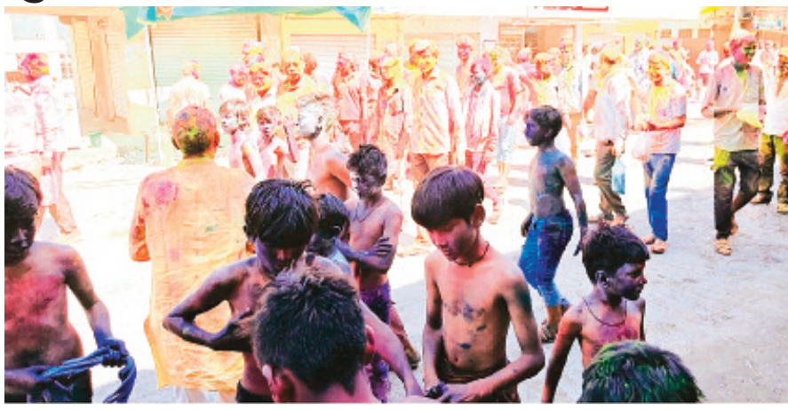
हरिभूमि न्यूज ►► छापीहेड़ा

प्रतिवर्ष की भांति रंगों की रंगरलिया एक दूसरे के साथ अटखेलिया खेलने का मजा तो सिर्फ रंग पंचमी के दिन ही पूरा होता है क्योंकि लोग कई दिनों पहले से इस त्यौहार के इंतजार का इंतजार करते हैं छापीहेड़ा में नन्हे नन्हे बच्चे रंगों से भरी पिचकारीया बंदूके लेकर रंगों के गुब्बारे एक दूसरे पर फोड़ने का कार्य इस दिन निरंतर जारी रखते हैं नगर के सभी प्रयुद्ध जन लोग एकत्रित होकर डीजे के साथ तथा नपा की फायर ब्रिगेड की पानी की धार के साथ नाचते गाते एक दूसरे को रंग लगाते हुए बस स्टैंड से रवाना होकर तालाब परिसर पाटीदार मोहल्ला कुशवाह काची मोहल्ला के दरकिनार होते हुए स्वर्णकार गली के माध्यम से बाजार चैक श्री राम मंदिर परिसर के आन्-बाजू नाचते हुए इस त्यौहार में मनोरंजन